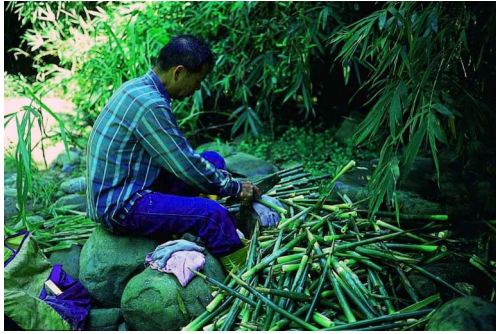
圖 7. 採筍人在現場進行初步處理的工作