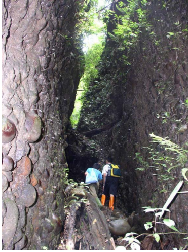
圖 5. 採筍人常要攀爬被雨水沖刷出的峽谷而上