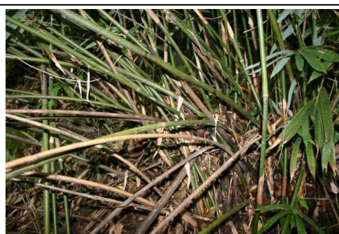
圖 2.蓬萊竹叢生的情形