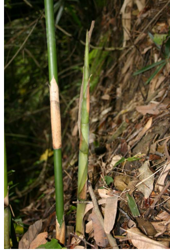
圖 6. 蓬萊筍只比大拇指稍粗一些