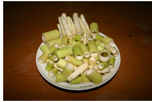
圖 8. 處理後的蓬萊筍 有筍尖的部分和節間附近的部分