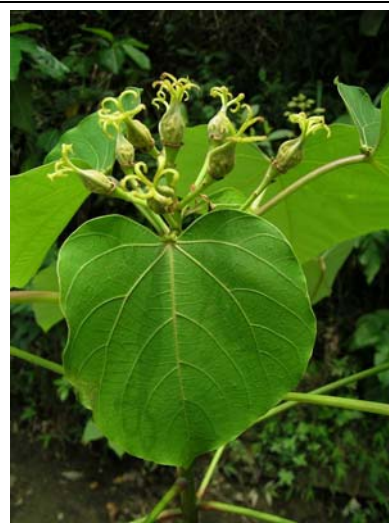
雌花謝後，受孕的雌蕊逐漸發育為果實