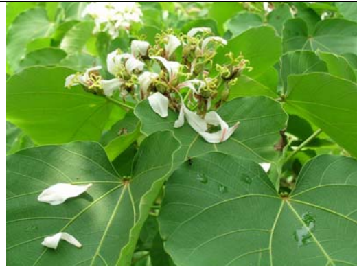
廣東油桐的雌花開後，花瓣會一片片逐漸脫落，留下雌蕊