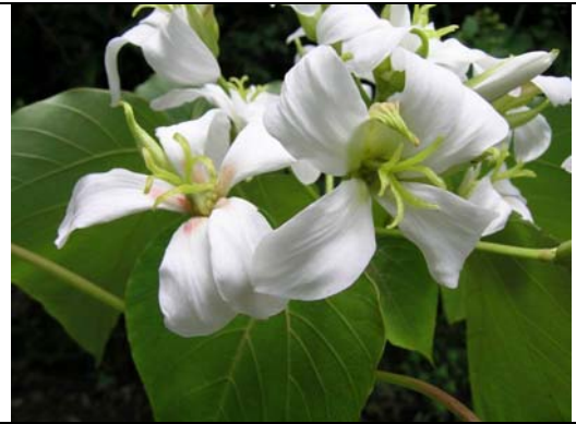
廣東油桐的雌花，花心雌蕊頂端的柱頭分成三叉，每叉再分兩叉，與雄花一樣，剛開時花心淡綠色，後也逐漸轉成褐紅色