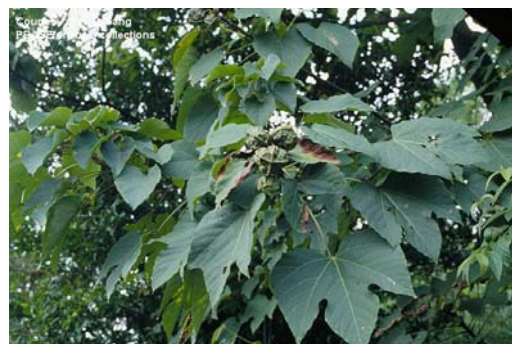
廣東油桐果實外有縐紋，所以又常被稱為皺桐，三稜偶而有四稜的