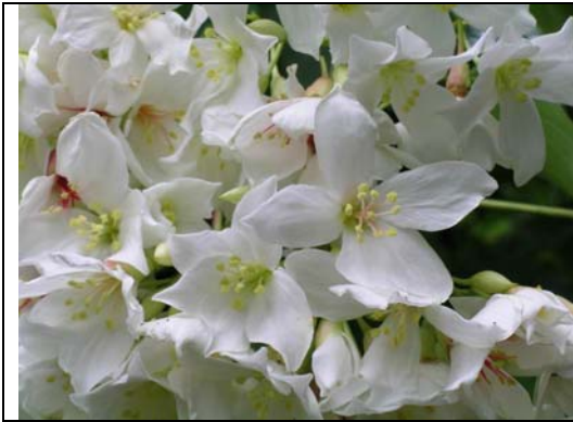
廣東油桐的雄花，花瓣 4 或 5 瓣，花心雄蕊基部的花絲合生在一起，常整朵掉落，剛開時花心淡綠色，與雌花一樣，後逐漸轉成褐紅色